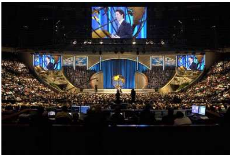
Joel Osteen nella colossale Lakewood Church

Uno dei principali protettori del "messaggio positivo", della "confessione positiva", "pensiero positivo", "ottimismo senza limiti" è senza dubbio alcuno Joel Osteen, il pastore della congregazione più grande degli Stati Uniti, Lakewood Church, a Huston, Texas.